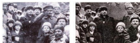
Ejemplo 6: Lenin y Trotsky