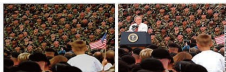
Ejemplo 4: Bush y el ejército