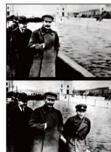
Ejemplo 8: Stalin y Yazhev