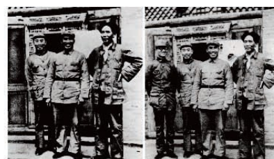
Ejemplo 10: Mao y sus camaradas