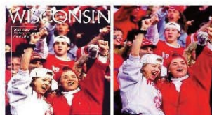
Ejemplo 7: Las minorías étnicas