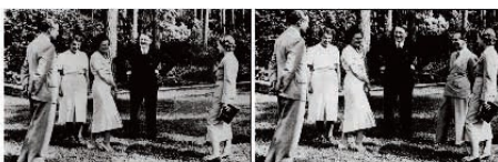
Ejemplo 3: Adolo Hitler y sus amigos