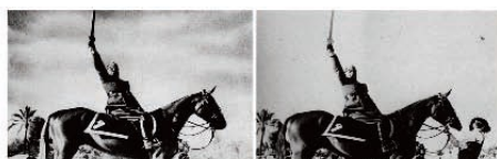
Ejemplo 5: Mussolini y su caballo